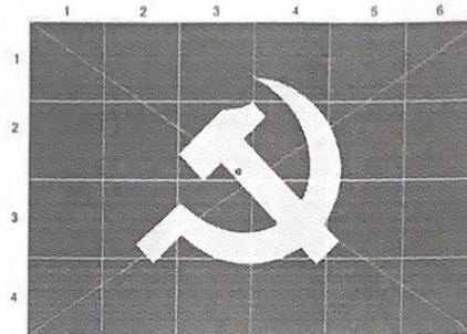
2. Hình 1b: Chia ô Đảng kỳ (Chấm “xanh” là tâm Búa Liềm)

+ Quốc kỳ: Các cạnh của cánh sao thẳng hàng; một cánh sao hướng thẳng đứng lên trên; các cánh sao bằng nhau.